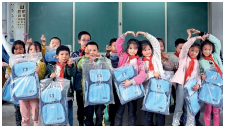
「港華輕風行動」惠及重慶市綦江區，向當地學校捐贈文具和教學用品。