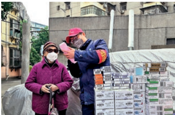
疫情爆發初期，各地港華義工走進社區積極支援抗疫。

2020年，我們再度舉辦「港華輕風行動」，於重慶市綦江區捐贈學校用品及文具，並向區內22所小學贈送兩噸港華紫荊農場出產之大米。我們亦於年內探訪廣東省清遠市一所小學，送贈電腦、桌椅和體育用品，義工隊更協助建設「港華愛心書庫」，以及翻新學校設施。